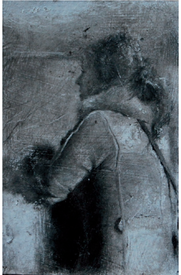
Tabú Lápiz sobre papel 15 x 10 cm. 2013