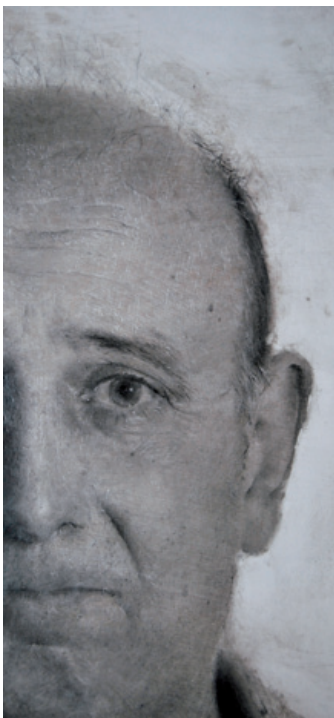
Detalle de M. A. Lápiz sobre papel 96,5 x 88,5 cm. 2014

Edita: Museo de Dibujo “Julio Gavín-Castillo de Larrés” y Amigos de Serrablo