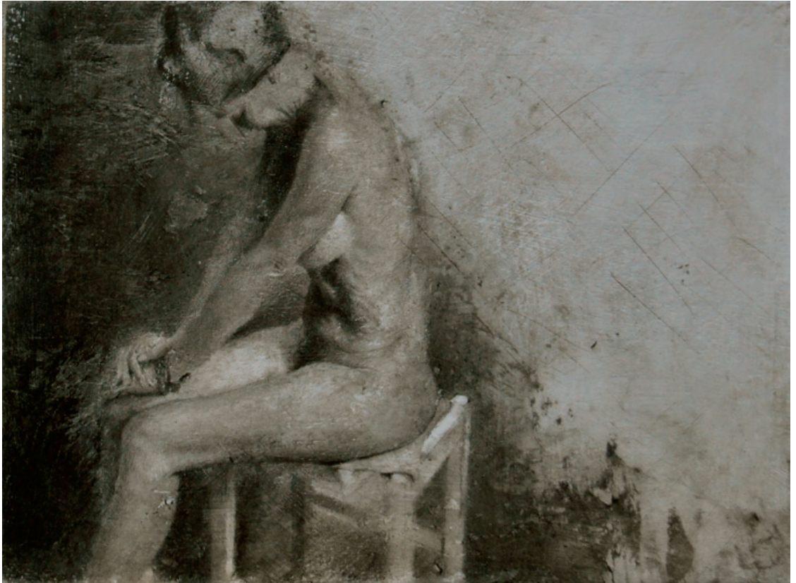
Desnudo en el estudio